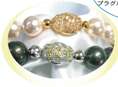
写真: 上/TML-5406ZG OR 下: TML-5406Z GR かざりっ子を併せて使用